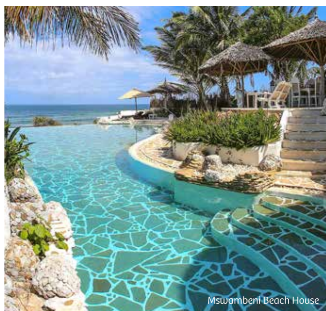
Mswambeni Beach House

Een safarireis is vaak een once-in-a-lifetime ervaring. Om die nog onvergetelijker te maken, bundelt Afrika-specialist Live to Travel de krachten met enkele Belgen die in Kenia elk hun bijzondere droom waarmaken. Het beste van Oost-Afrika in een 10-tal dagen ontdekken? Het kan!